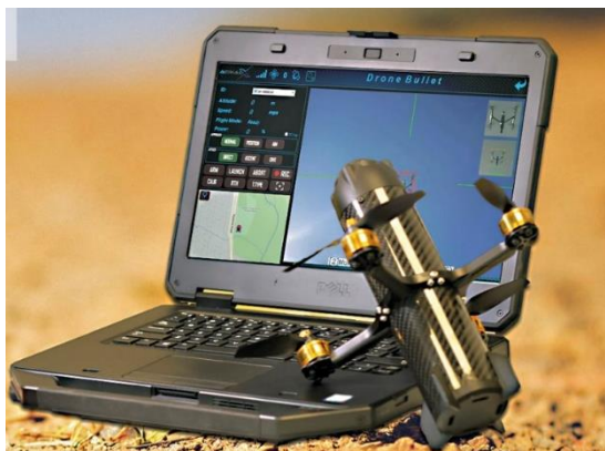
Рис.1 – Дрон-камикадзе

Применение противодронов подразумевает использование дронов-перехватчиков (рис.1) или дронов-камикадзе (рис.2). Предполагается наличие парка автоматизированных дронов и в ряде случаев специально подготовленного оператора. Возникает необходимость в дополнительных ресурсах, также техническом обслуживании и ремонте дрона после каждого налета противника на охраняемый объект. Такой метод мало пригоден для охраны объекта от средних и больших БВС (в основном самолетного типа), а также в условиях применения БАС. Система рассчитана на эксплуатацию в умеренных погодных условиях, что является безусловным ограничением в ее применении.