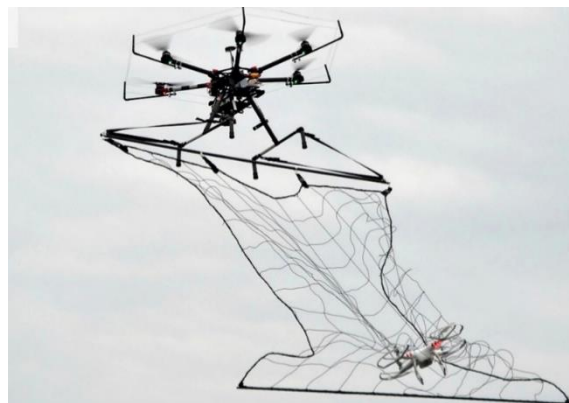
Рис. 2 – Дрон-перехватчик

Применение сетей-ловушек (рис.3) относится к одному из самых экономичных контактных методов противодействия БВС (дронам, коптерам). Такое средство почти универсально, так как зависит лишь от мощности устройства запуска сети и от особенностей пожаро-, взрывобезопасности охраняемого объекта, когда недопустима произвольная посадка (падение) ударного дрона, дрона-камикадзе, так как он может взорваться. Развитие и автоматизация таких систем сегодня не требует специфических навыков от оператора, что позволяет интегрировать их в многофункциональную систему охраны.