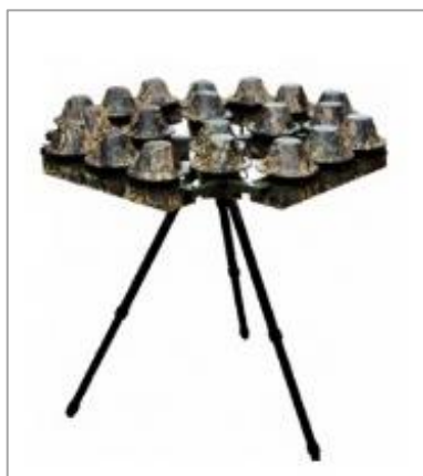
Рис. 4 - Переносной (стационарный) комплекс противодействия БВС «Купол-про»

Наиболее эффективным на сегодняшний день в борьбе с БАС, БВС (дронами, коптерами) является переносной (стационарный) комплекс противодействия БВС всенаправленного действия 360^{\circ} \times 180^{\circ} (рис. 4). При включении мгновенно создается «непроницаемая» для БАС, БВС (дронов, коптеров) защитная полусфера радиусом не менее 2 км одновременно в 10 частотных диапазонах.